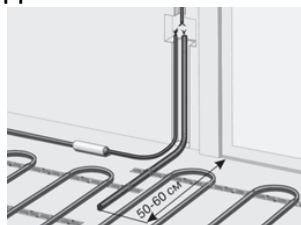
Рисунок 1. Подключение греющего кабеля и датчика

Длина провода датчика — 3 м. Допускается увеличение длины провода к термодатчику до 10 м. Сечение провода термодатчика должно быть не менее 0,2 мм 2 .