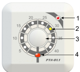
Рисунок 3. Внешний вид